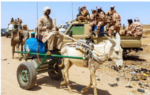
Une charrette chargée de carburant passe devant des soldats tchadiens à Tiné, dans la province du Wadi Fira (Tchad), près de la frontière avec le Soudan.

Plusieurs communautés historiquement influentes au Tchad sont aujourd'hui engagées — directement ou indirectement — dans le conflit soudanais selon des alignements divergents. Certains segments des communautés touboues, arabes et goranes , concentrées dans le nord du Tchad et l'espace sahélo-saharien, se sont rapprochés de réseaux liés aux FSR, conférant à leur position une portée transnationale. À l'inverse, une part significative de la communauté zaghawa s'est alignée sur les FAS, par solidarité avec leurs proches au Darfour et en réaction au soutien perçu de N'Djamena aux FSR. Ces alignements divergents traduisent une polarisation communautaire croissante qui met sous tension les équilibres internes du pouvoir.