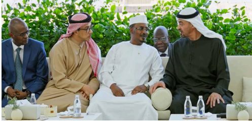
Le président tchadien Mahamat Idriss Déby rencontre le président des Émirats arabes unis, Mohammed ben Zayed Al Nahyan.

millions de dollars accordée en 2023, dont 50 millions sous forme de don. Au total, ces 700 millions de dollars engagés en moins de deux ans représentent environ 15 % du budget annuel de l'État tchadien. Au-delà de ces financements publics, des observateurs ont également souligné l'existence de liens économiques et d'intérêts privés croisés entre certains cercles décisionnels tchadiens et émiratis, renforçant la perception d'une interdépendance stratégique.