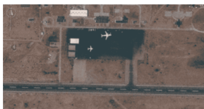
Image satellite d'un avion-cargo Iliouchine Il-76 stationné sur le tarmac de l'aéroport d'Amdjarass, dans l'est du Tchad.

Issues des milices janjawid actives au Darfour et au Kordofan , les FSR ont progressivement consolidé leur pouvoir militaire et économique, notamment par le contrôle de sites aurifères stratégiques. Des enquêtes internationales ont documenté l'implication de réseaux liés à des acteurs russes et émiratis autour de zones comme Jebel Amer. Cette convergence entre ambitions militaires et intérêts économiques extérieurs a contribué à la régionalisation du conflit, avec des répercussions directes sur les États voisins, dont le Tchad.